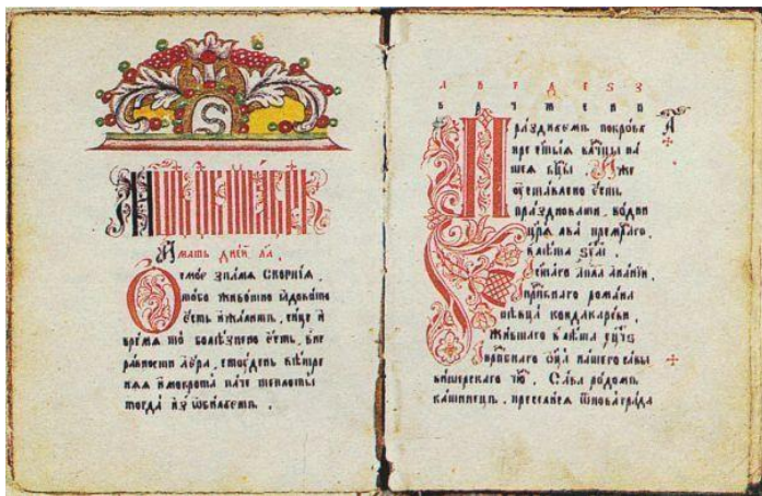
Рис. 1 «Рукописная книга»