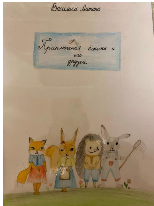
Рис. 4 «Обложка книги»